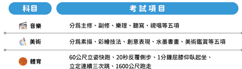
表三、術科考試科目及考試項目