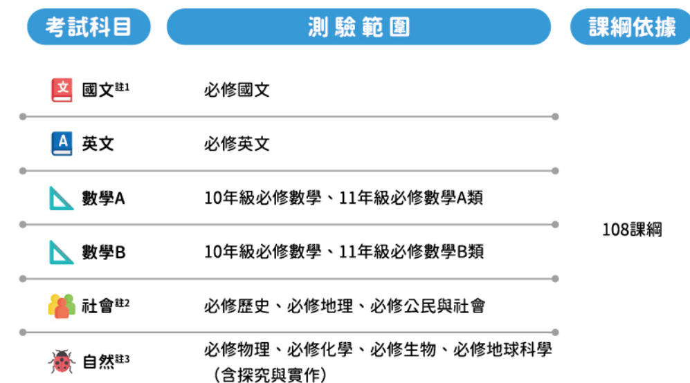
表一、學科能力測驗的測驗範圍