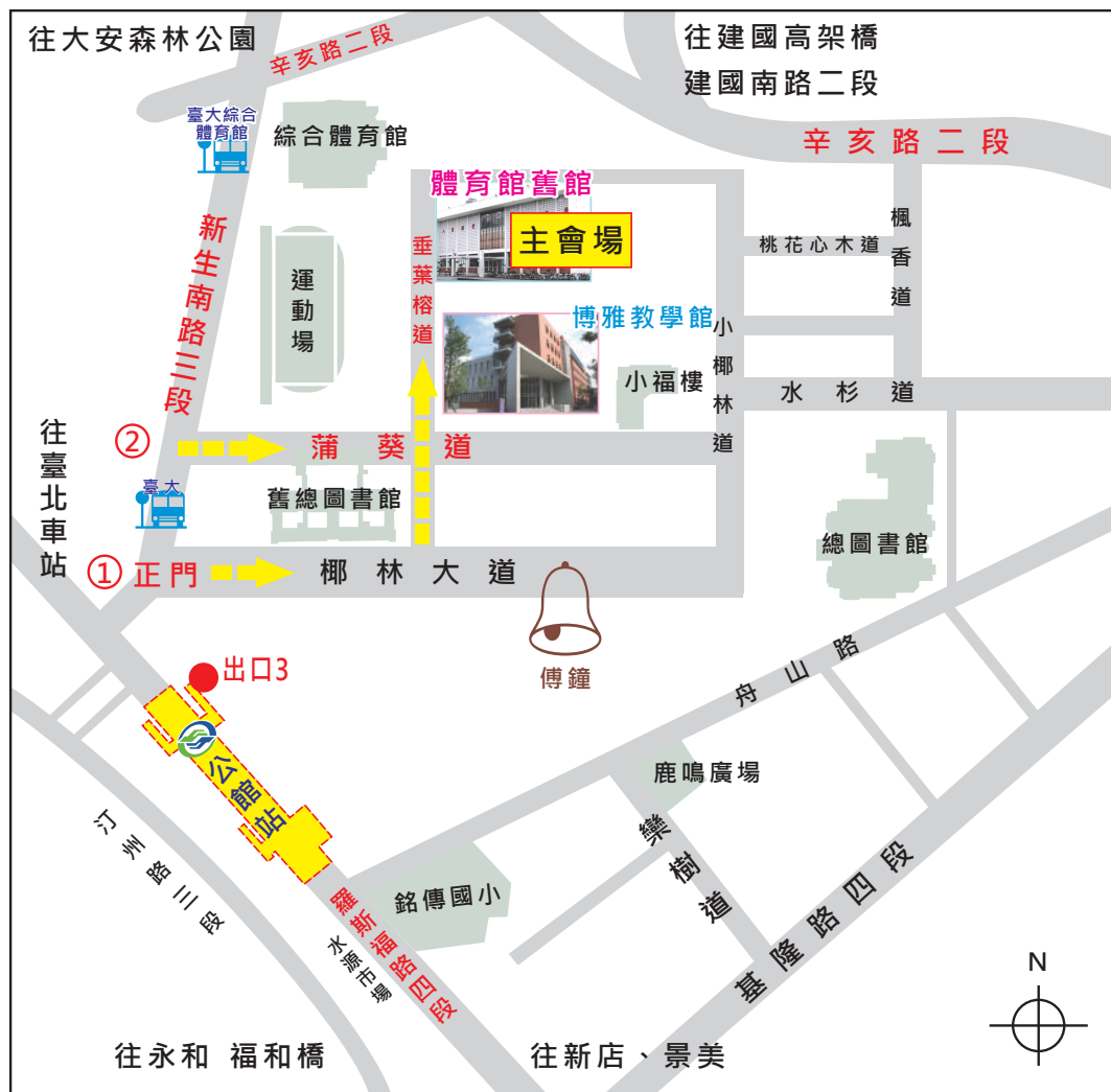
圖4 與會人員步行入校動線