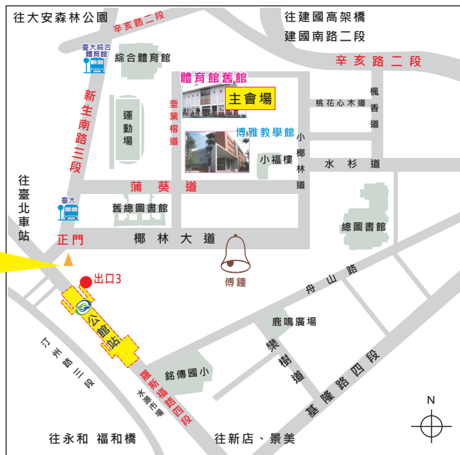
圖2 正門上下車停靠區示意圖

正門上下車停靠區為學校正門廣場。屏東縣、連江縣、臺南市、高雄市、嘉義市、雲林縣、新竹市、彰化縣、苗栗縣。