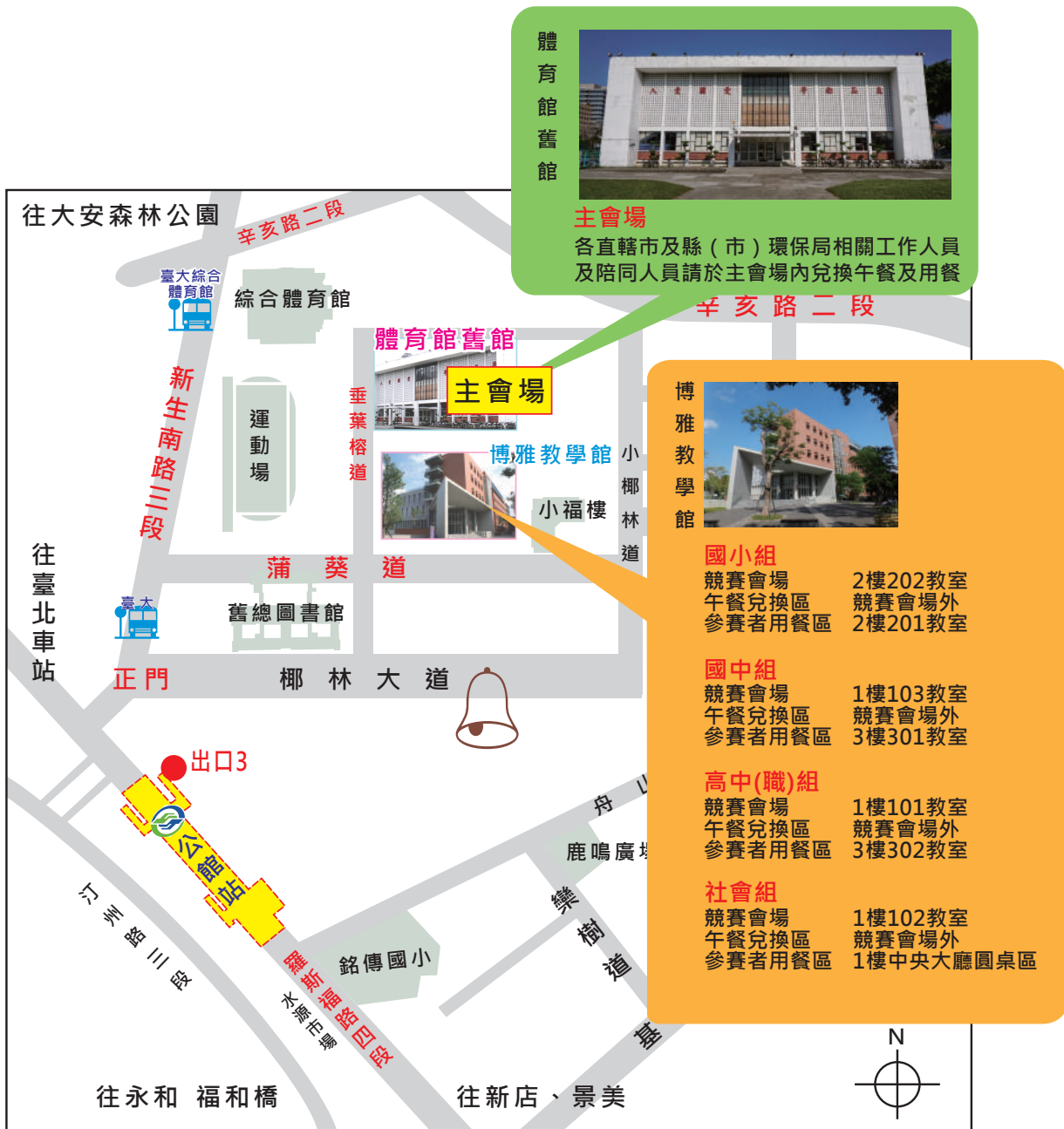
圖 5 活動會場配置圖