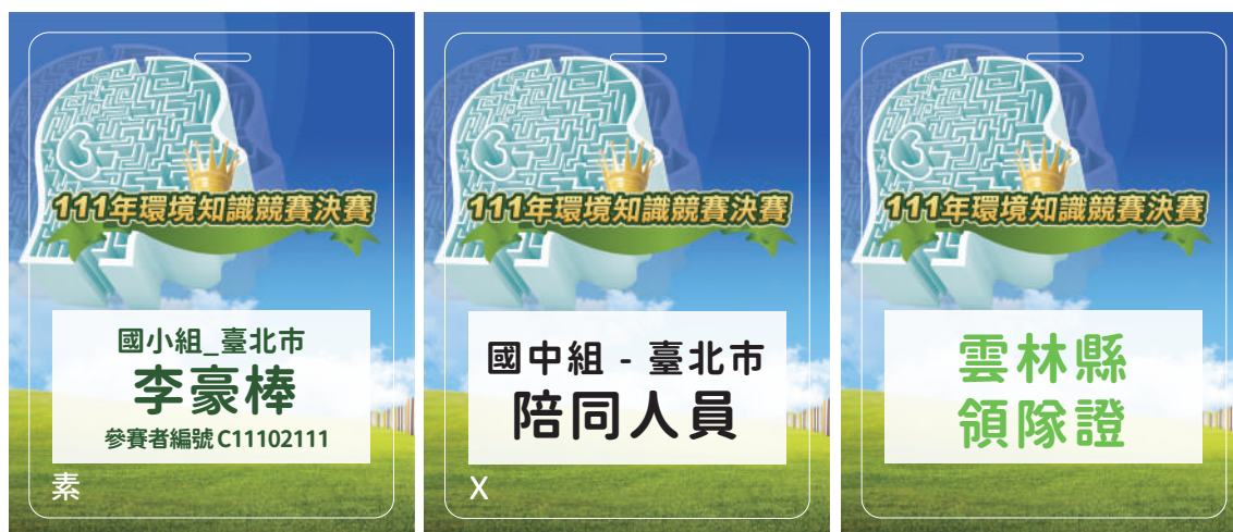
圖 8 與會人員大會名牌圖