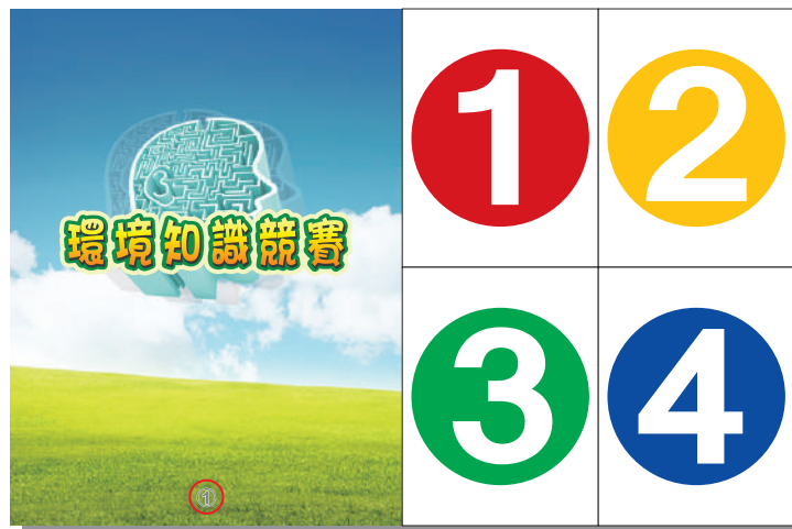
圖 7 數字舉牌圖