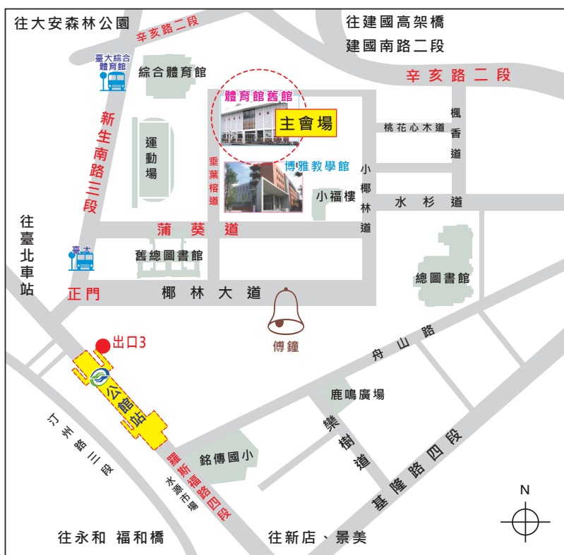
圖 1 國立臺灣大學平面圖