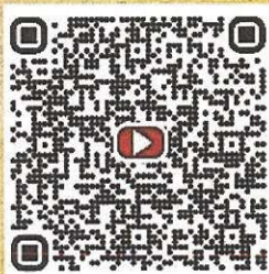
第二輯 成語故事影音視頻