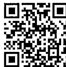
繳件 QR code