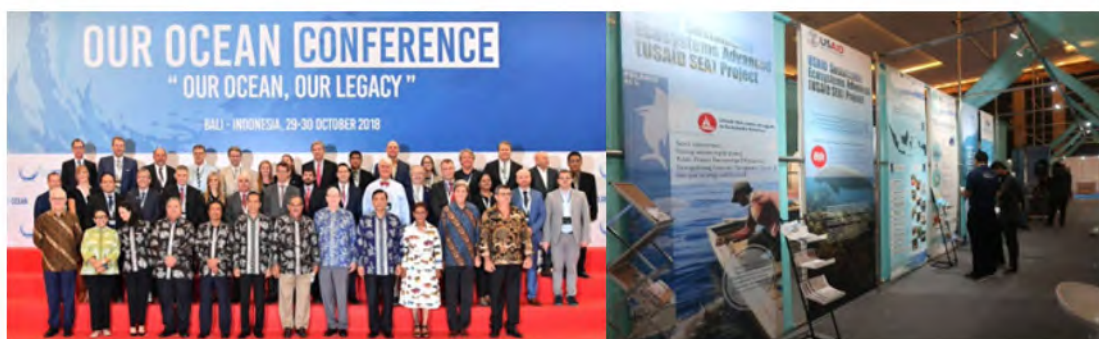
圖說／2018年印尼會議，左為出席高層官員，右為會外展覽場館