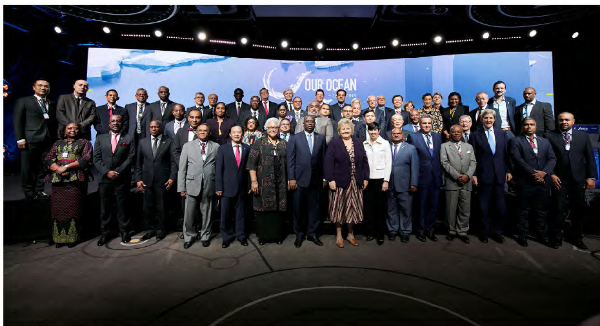
圖說／「我們的海洋會議」合照（2019年）

對海洋做出承諾，讓海洋永續發展，是全世界皆應努力的方向。本篇介紹已舉辦6屆的「我們的海洋會議」，介紹全球致力於海洋保育，互相分享經驗、提供看法、並起身行動的努力。