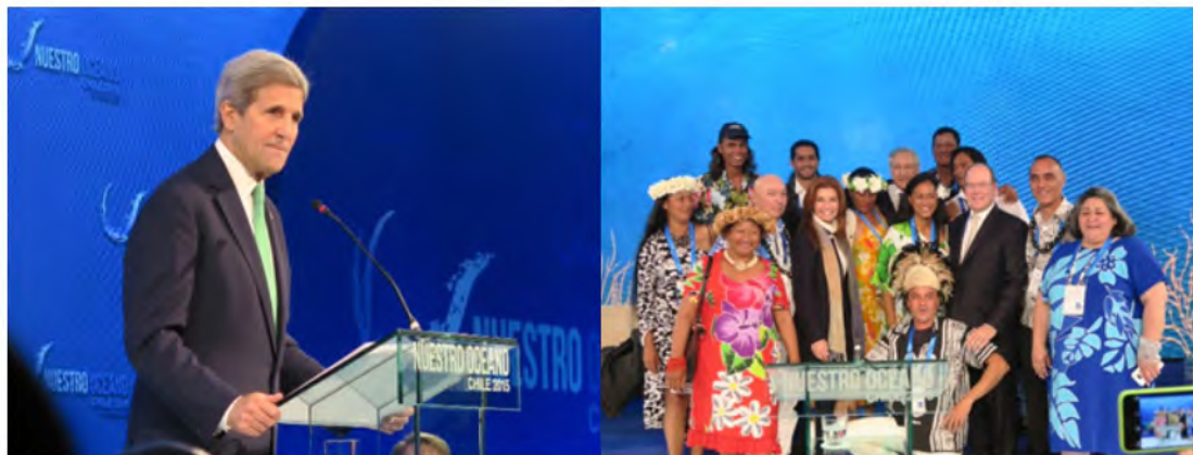
圖說／2015年「我們的海洋會議」於智利舉辦，美國國務卿凱瑞於會議上發言（左），智利復活島原住民與外交部長等慶賀通過海洋保護區（右）

此波對海洋的熱愛逐漸擴散，2015年於智利瓦萊帕萊索、2016年於美國華府、2017年於歐盟馬爾他、2018年於印尼峇里島、2019年於挪威奧斯陸，接下來2020年8月將於帛琉舉辦第7屆會議，在此讓我們回顧這6年所累積的資產。