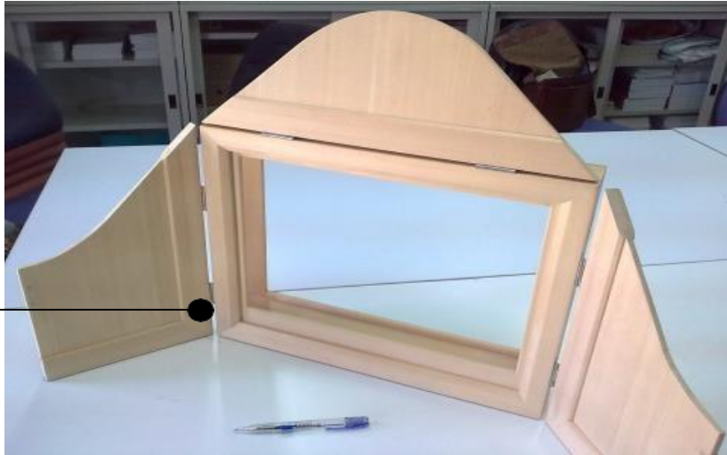
圖卡經由左方進行抽換。